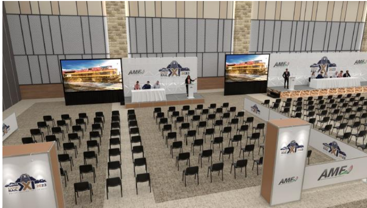
Mesa de Trabajo 3 Seminario Mecánico / Izquierda